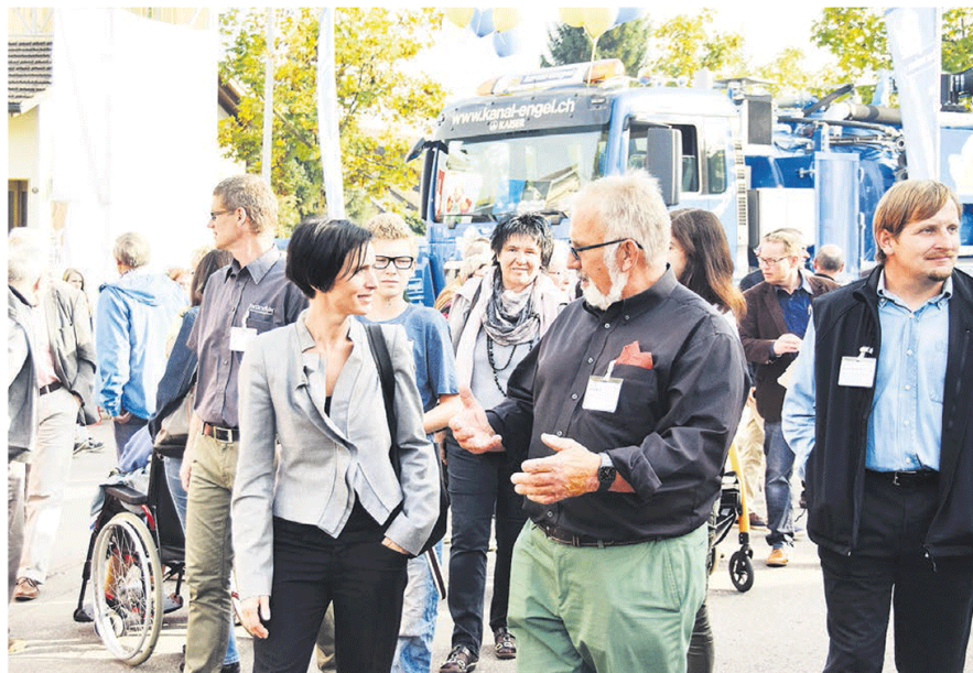
Nach ihrer Eröffnungsrede ging Ständerätin Pascale Bruderer mit dem OK und geladenen Gästen auf den Messerundgang.

Anzeiger für das Oberfreiamt, 10. Oktober 2014