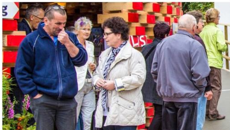
Die Handwerker und Gewerbetler hatten für die Gestaltung der Ausstellung erneut keinen Aufwand gescheut.

von Verena Schmidtke — az Aargauer Zeitung • Zuletzt aktualisiert am 5.10.2014 um 22:19 Uhr