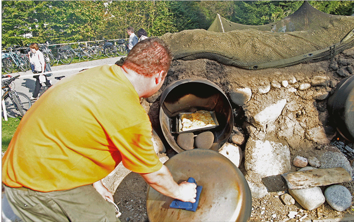
Auch die ZSO Oberfreiamt präsentierte sich an der Siga – und servierte dort im Koreaofen hergestellten Flammkuchen